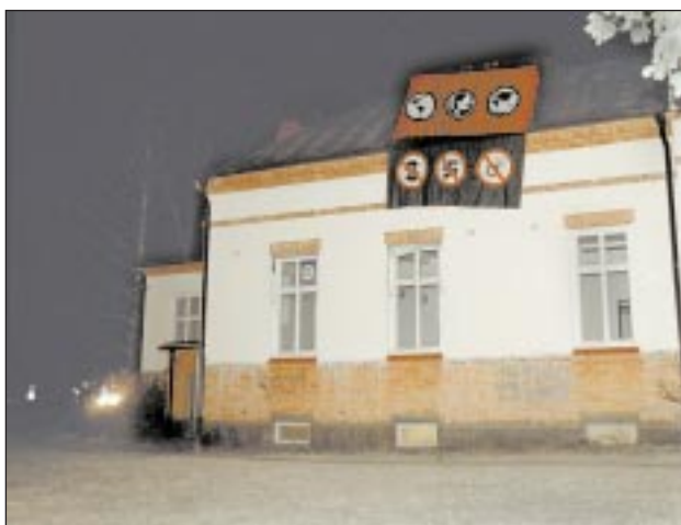
Gamla Westmanska BB, som nu är ockuperat, ingår i bostadsprojektet på Kanberget. Huset är tänkt att rymma sex lägenheter.

Här ska de bygga rikemanslägenheter. Vi har fått nog.