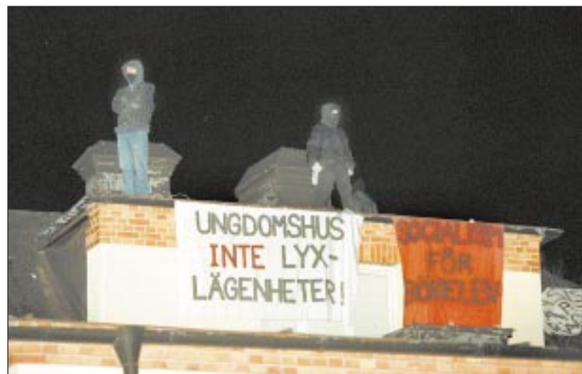
På väggarna hänger banderoller med gruppens slagord.

Här ska de bygga rikemanslägenheter. Vi har fått nog.