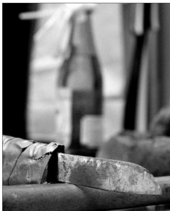
Ockupanterna har tillverkat egna tillhyggen, här ett hemmagjort spjut, en kniv fäst vid en metallskena.