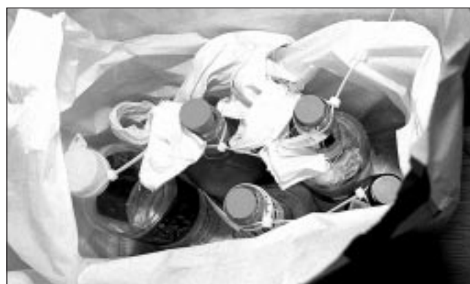
Bensinfyllda flaskor, så kallade molotovcocktails hittades inne i Westmanska BB.